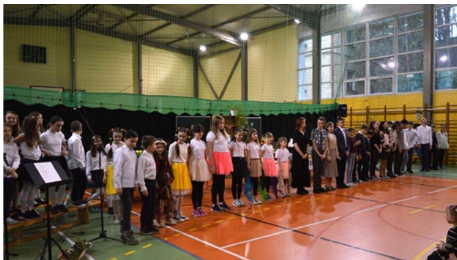
Aktorzy przedstawienia Taka miłość zdarza się tylko raz