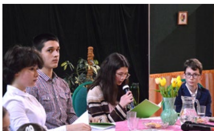
Recytacja wierszy Szymborskiej