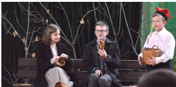
Na krakowskim rynku