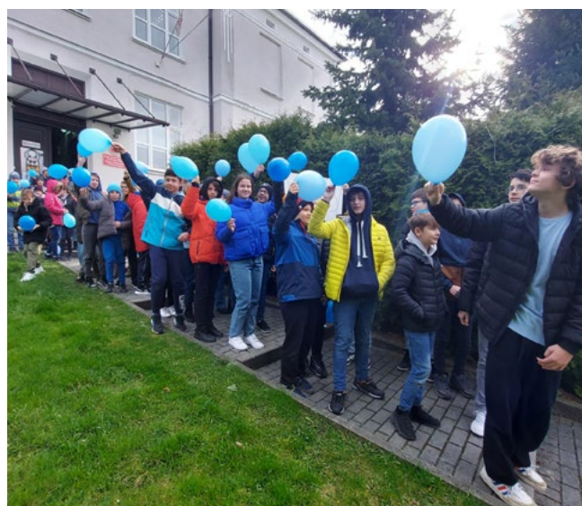
Niebieski Marsz dla Autyzmu