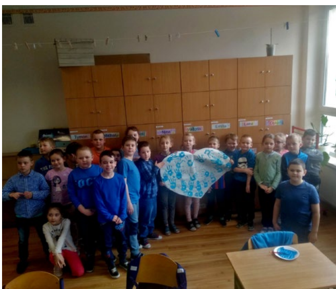
Światowy Dzień Świadomości Autyzmu – zajęcia w klasie 1