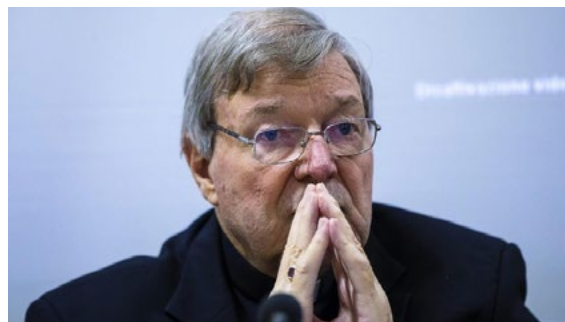
Kard. George Pell

Australijski purpurat został oskarżony w swoim kraju o molestowanie seksualne dwóch chórzystów w zakrystii katedry w Melbourne w 1996 r. Po unieważnionym procesie w 2018 r., w drugim procesie jednogłośnie został skazany na sześć lat więzienia. Spędził w nim ostatecznie 404 dni (27 lutego 2019 – 8 kwietnia 2020), aż do momentu, kiedy to Sąd Najwyższy Australii jednogłośnie go