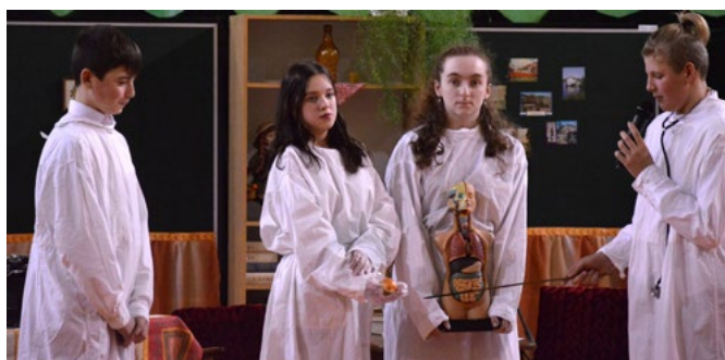
Występ klasy 7