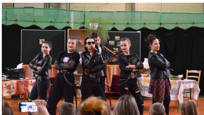
Taniec klasy 8